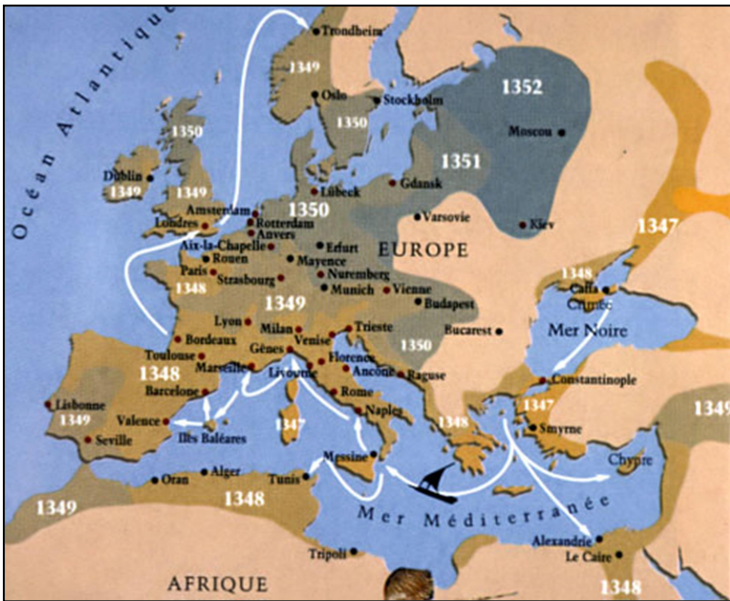
Document 1: De pest in de 14 de eeuw